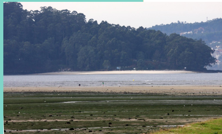
Area da Illa e punta Corveira