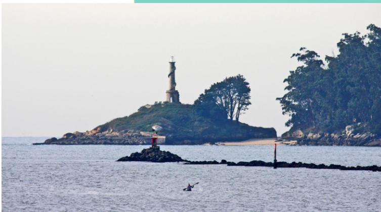
Faro e punta de Tenlo

A illa de Tambo está separada da costa de Poio por unha canle de 1,1 km, de pouca profundidade. A súa superficie é de 0'28 km 2 , cunha altura máxima de 80 m, e un perímetro de 4 km. No século VI houbo unha capela e logo un mosteiro. No século XII era propiedade da raíña Urraca e logo foi doada ao convento de San Xoán de Poio. En 1846, coa desamortización pasa a mans privadas e é mercada polo ministerio de Xustiza. Funcionou como lazareto e penitenciaría militar. En 1943 coa creación da Escola Naval Militar de Marín pasa a uso militar e emprégase como arsenal. Desde outubro de 2018 permítense visitas organizadas á illa. Está proposta a súa inclusión no Parque Nacional das Illas Atlánticas.