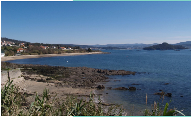
Punta do Mar. Ao fondo a praia do Laño, a punta de Samieira e a illa de Tambo