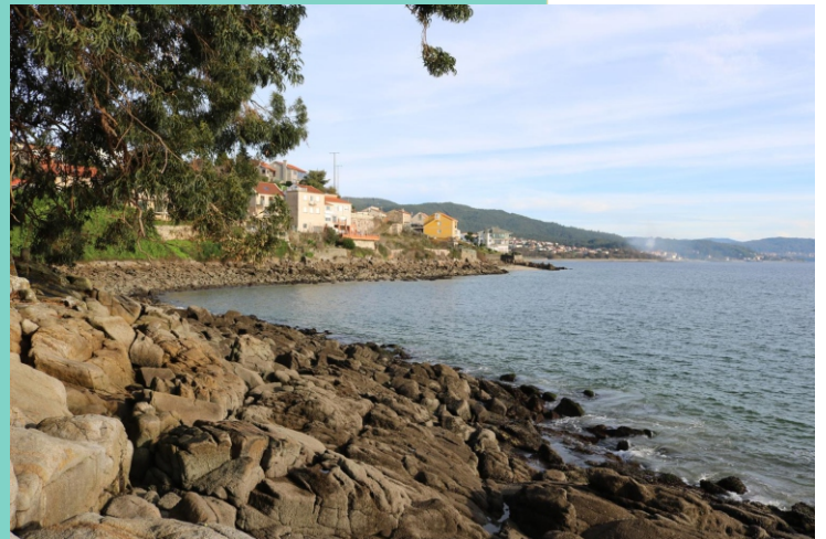
3-Enseada das Sinás