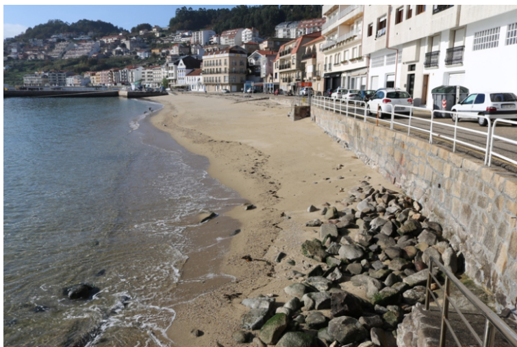
Praia e porto de Raxó.

A Ría de Pontevedra é a máis pequena das rías baixas e ábrese, seguindo unha fractura con dirección SO-NE, entre as puntas de Cabcastro, ao norte e o cabo Udra, ao Sur.