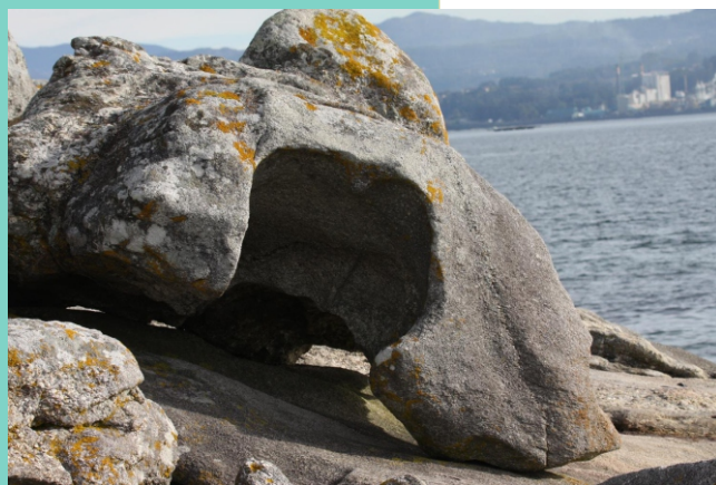
Punta da Cachola.