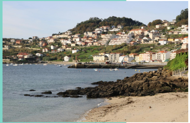
Praia das Sinás