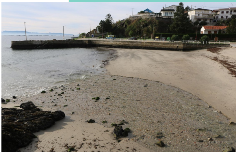
Porto e praia de Covelo