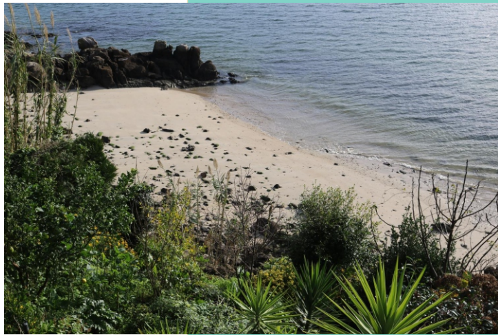
Praia A Lameiriña