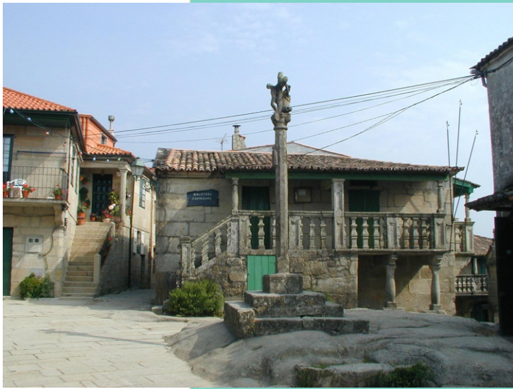
Vistas de Combarro