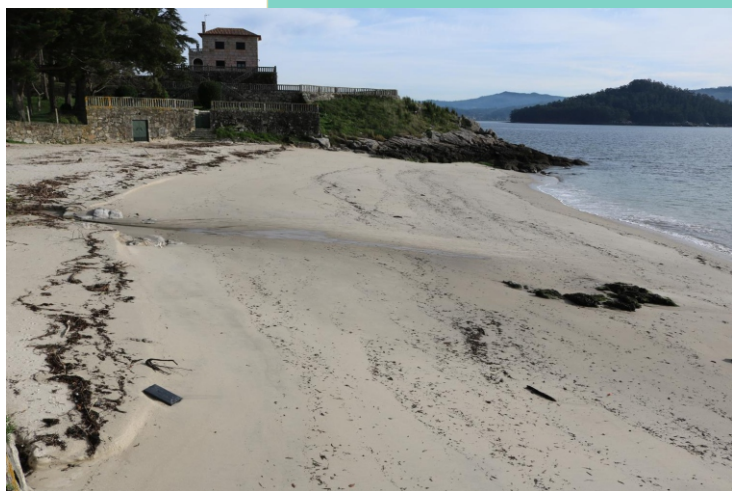
Area da Barca. Punta da Cachola.