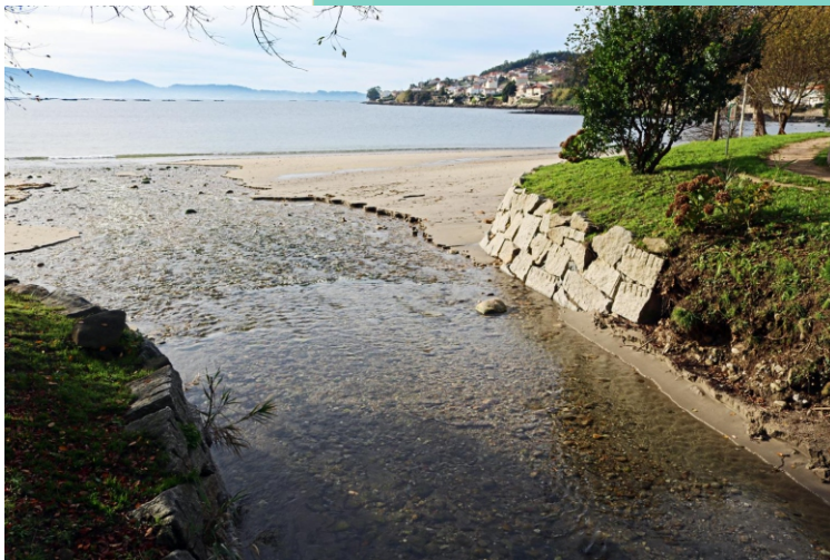
Rego dos Muíños