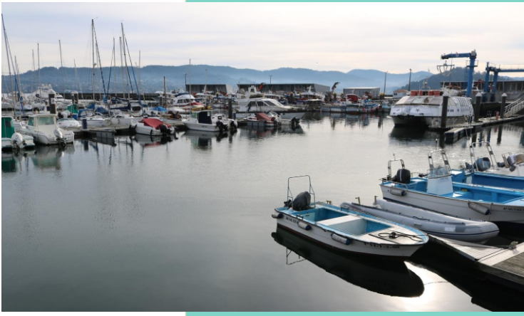
Peiraos de Combarro