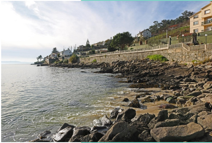
Punta Xunqueiro e Area da Covicha.