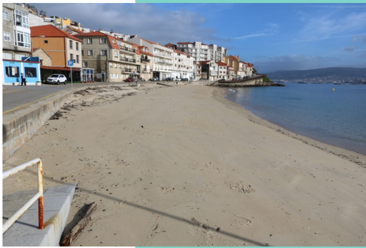
Praia de Raxó