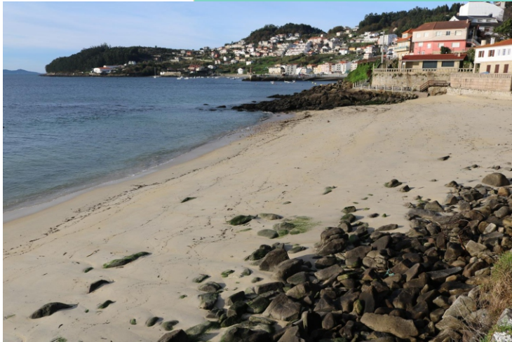
Praia das Sinás