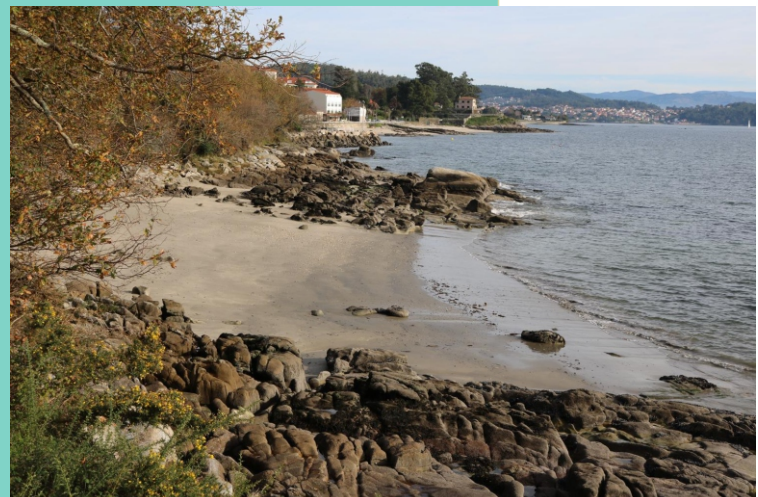
Praia do Caeiro