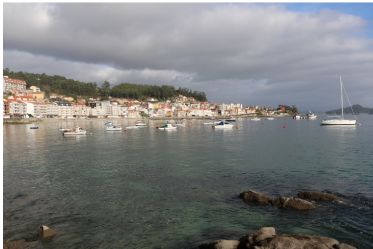
Raxó. Unha pequena vila mariñeira cun porto dedicado á pesca de baixura e o marisqueo.