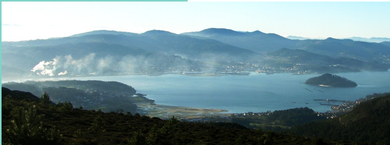
Ría de Pontevedra: enseada de Campelo, Combarro e Tambo (desde o Castrove)

Está separada da ría de Vigo pola península do Morrazo na que se eleva a Serra de Domaio. O río máis importante que desauga nela é o Lérez e do Castrove e Domaio baixan pequenos regatos. Na boca da ría atópase o arquipélago de Ons e no seu interior a pequena illa de Tambo.