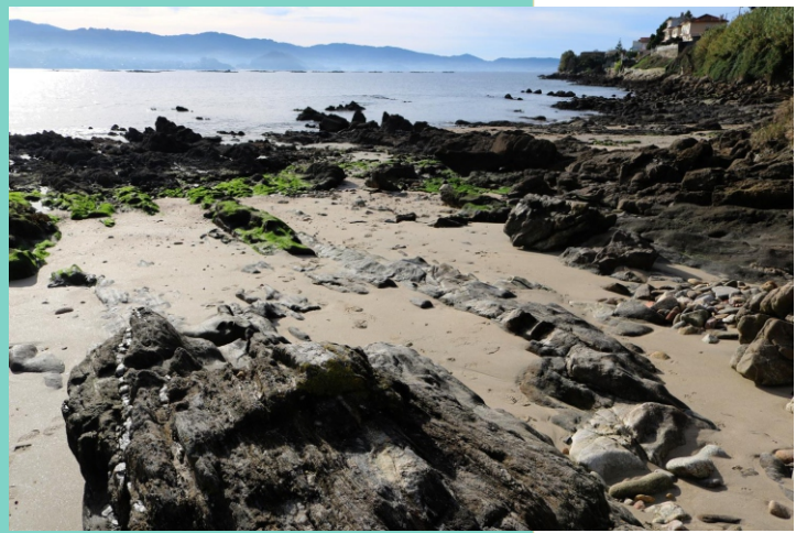
Punta do Mar.