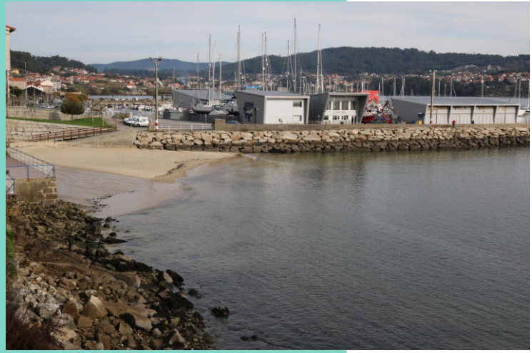
Praia da Canteira.