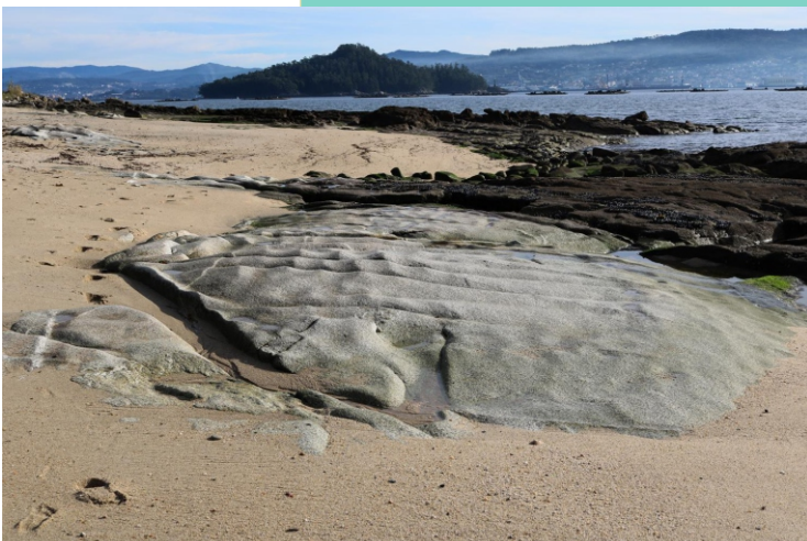
Punta de Samieira