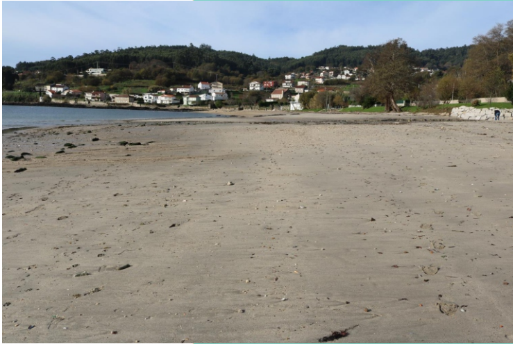
Praia do Laño. Rego dos Muíños.