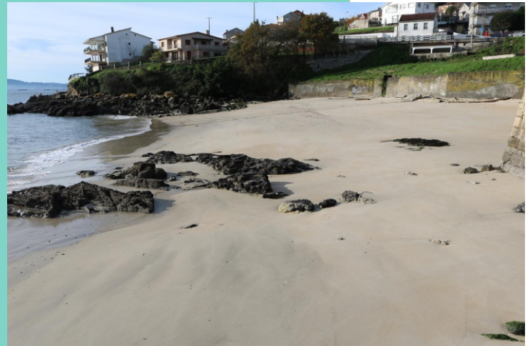
Praia de Fontemaior