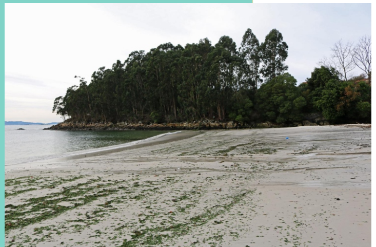
Praia de Chancelas e punta Carajilla