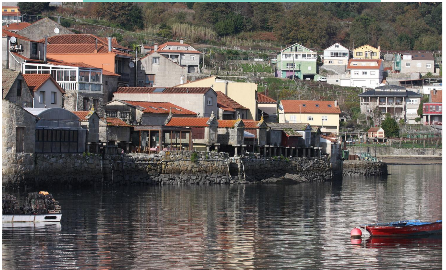
COMBARRO. Peiraos da Canteira e da Chousa.

Combarro, unha vila mariñeira que conserva un dos conxuntos arquitectónicos populares máis interesantes de Galiza e no que destacan as casas mariñeiras e os hórreos (máis de trinta) á beira do mar. Está declarado Ben de Interese Cultural, Conxunto Histórico e Sitio Histórico.