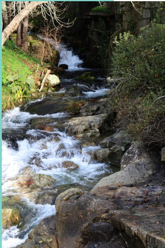
Rego de Covelo.