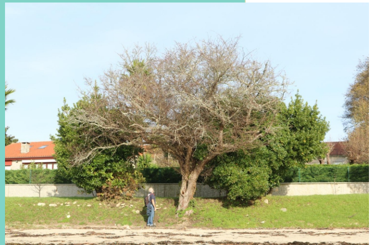
Estripo na praia do Laño